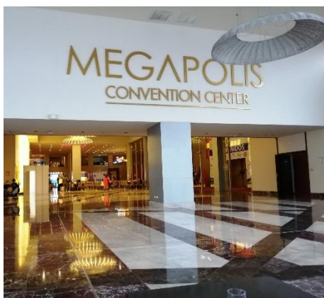
Megapolis Convention Center – Panamá Hotel Megapolis