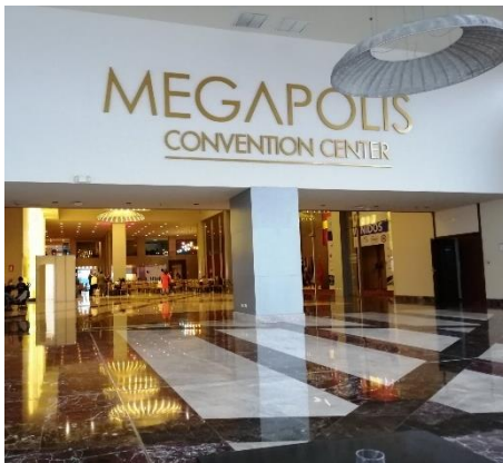
Megapolis Convention Center – Panamá Hotel Megapolis